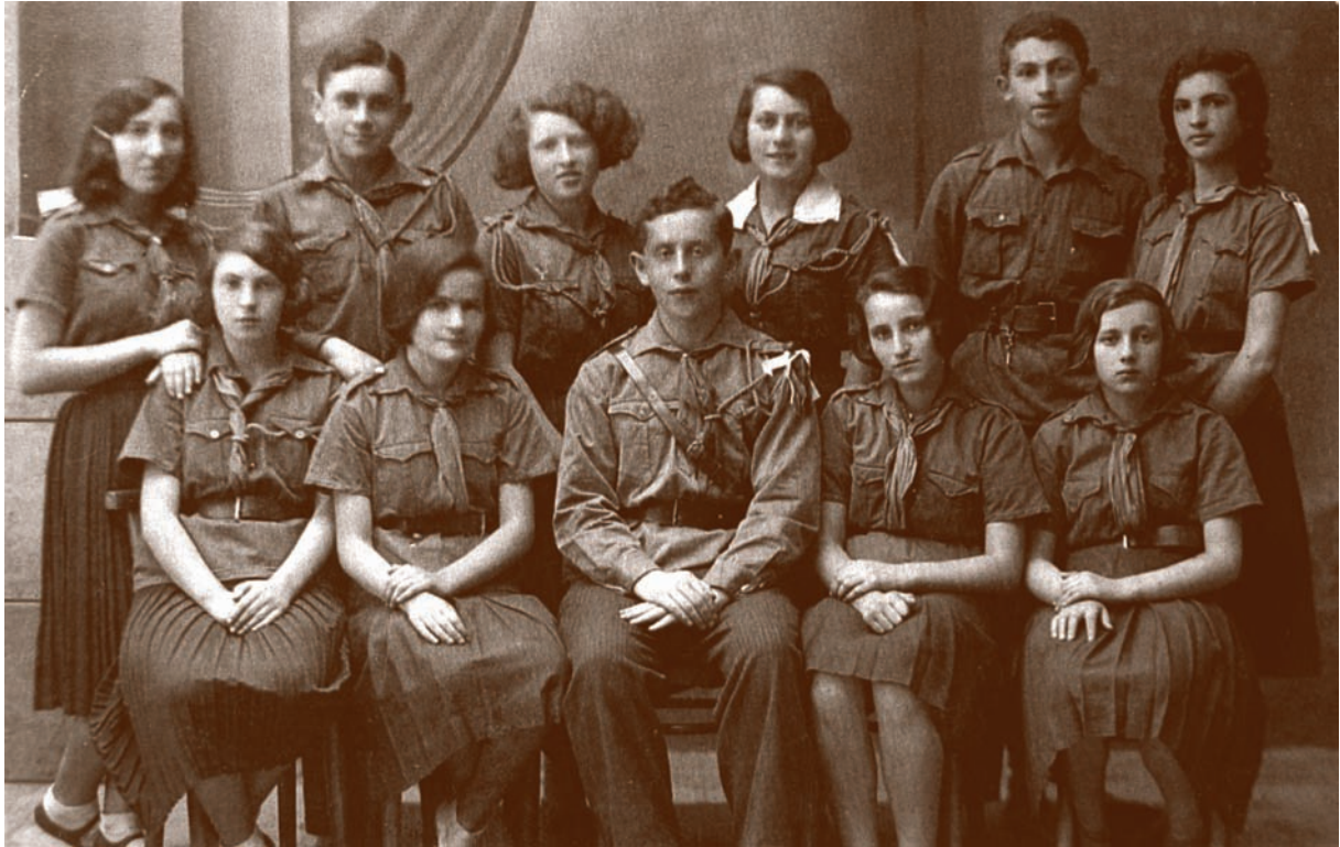
Żydowska organizacja skautowska Haszomer Hacair A group of members of the Hashomir Hatsair - Jewish scout organization CzY, s. 150