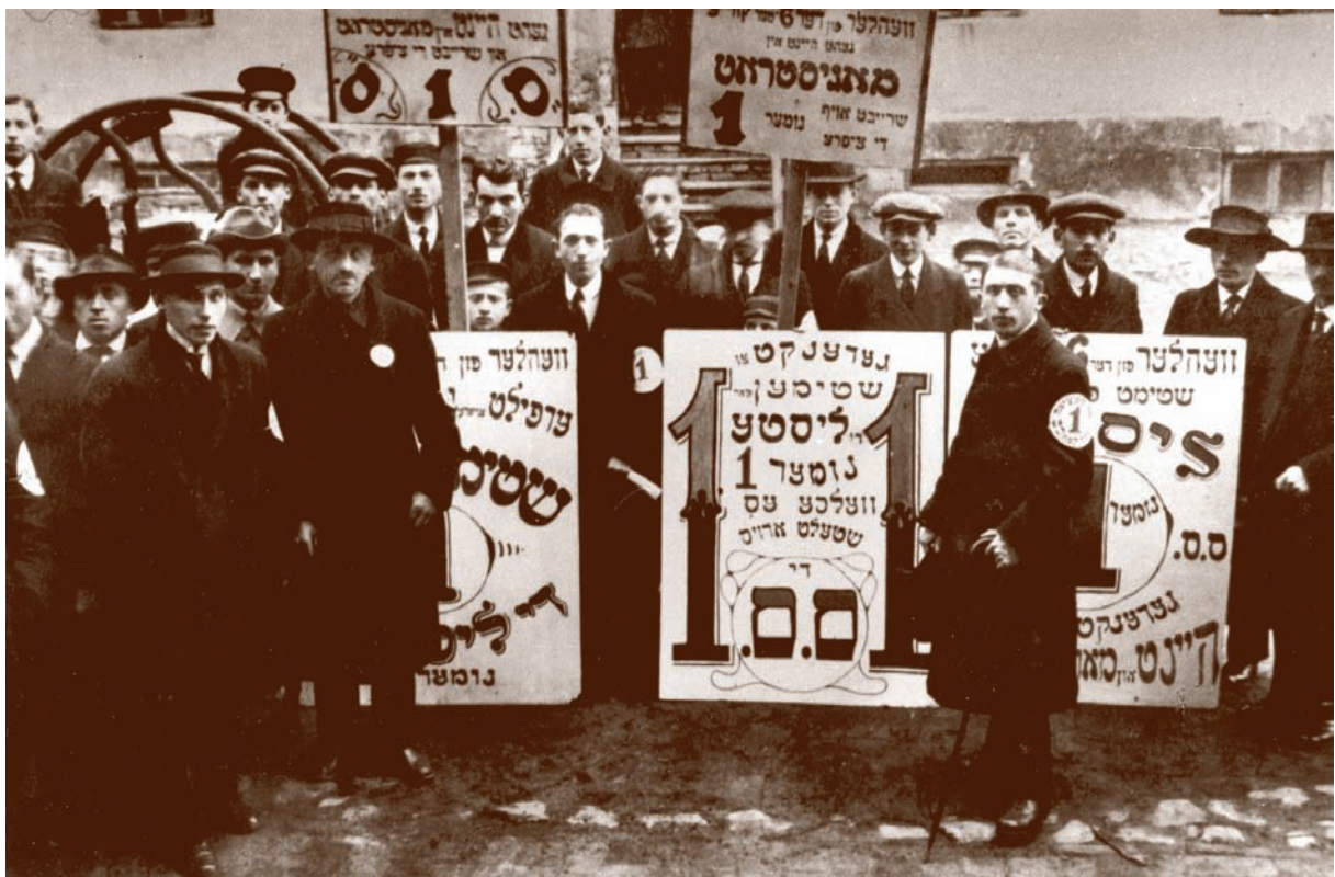
Zdjęcie z kampanii wyborczej do Rady Miejskiej Photographs of electoral campaign for the City Council CzY, s. 119