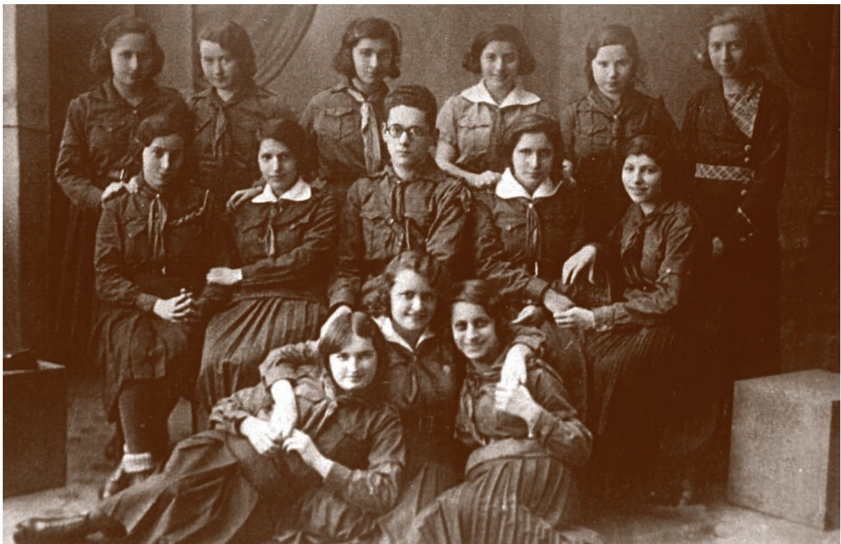
Syjonistyczna organizacja skautowska Hanoer Hacjoni A group of members of the Hanoar Hatsioni, a Zionist scout organization zb. E. Asz Mundlak