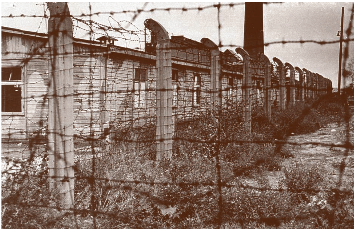
HASAG Pelcery