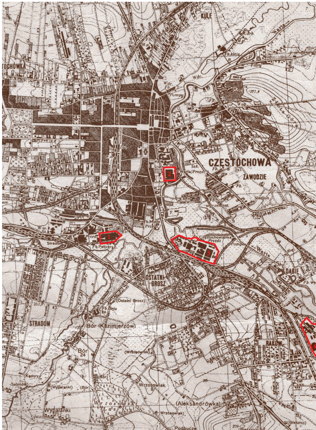
Plan miasta Częstochowy z zaznaczonymi obozami: Plan of Częstochowa with HASAG camps shown: